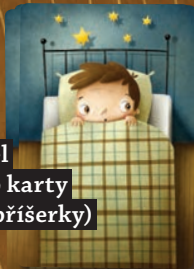
Postel (rub karty příšerky)